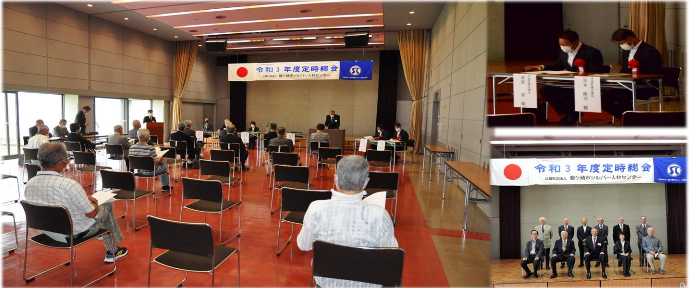
新型コロナウイルス感染症対策を講じて開催しました

(編集・発行) 公益社団法人 龍ヶ崎市シルバー人材センター 〒301-0004 龍ヶ崎市馴馬町 3202 番地 TEL 0297(64)3641 FAX 0297(63)0011 ホームページ : http://www.rsjc.sakura.ne.jp/ 発行責任者 : 塚本 将男 編 集 : 総務委員会