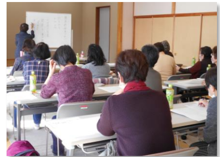
第4回女性交流の様子