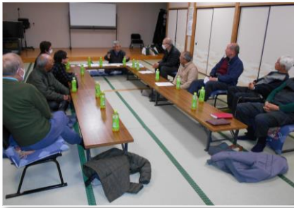
2月開催の八原地域班懇親会

平成29年度よりモデル5地域で開始した地域班ですが、昨年度で市内全域16班を設置しました。地域班活動は、班長を中心にそれぞれの地域のコミュニティーセンター等で開催され、地域班会議や交流会を開催し、会員の増強や就業拡大、地域ボランティア等についての理解を深め、協力をいただきながら行っています。