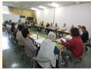
龍ヶ崎・大宮地区