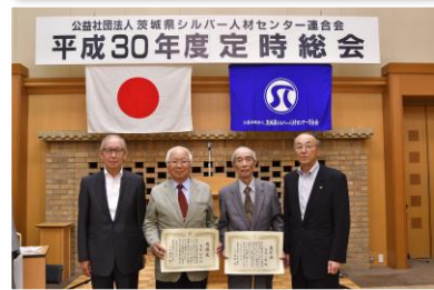
写真下：綿抜県シ連会長、塚本理事長との表彰者記念写真