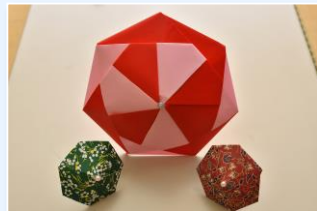
女性交流会の様子