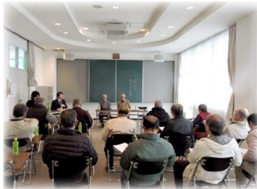
(写真は、馴染地区の会議の様子)

各地区会議が4月に開催され、今年度は理事の任期更新に当たるため、新理事候補者の選出を含め、活発な議論がなされました。